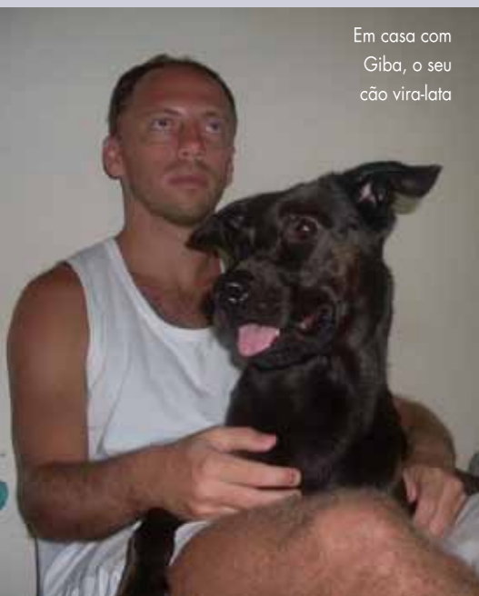
Em casa com Giba, o seu cão vira-lata

do mercado; estamos adquirindo uma estrutura que nos dá confiança e vontade de querer trabalhar cada vez melhor”, afirma.