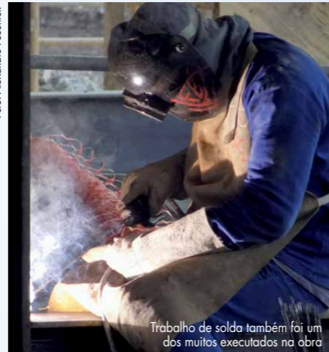
Trabalho de solda também foi um dos muitos executados na obra