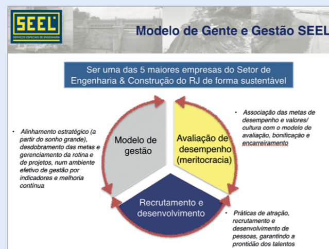
Gráfico esclarece importante papel do componente "Avaliação de Desempenho" dentro do novo Modelo de Gente e Gestão da SEEL

borador saiba como seu superior enxerga e analisa seu trabalho. "A avaliação de desempenho estreita a comunicação entre os líderes e liderados, alinha expectativas, aprimora habilidades, melhora desempenho, reconhece resultados, desenvolve talentos e traz melhores resul-