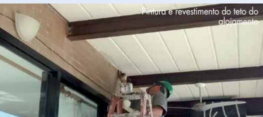
Pintura e revestimento do teto do alojamento

O passo a passo das ações da SEEL vem sendo acompanhado pela empresa Jacobs Guimar Engenharia, gerenciadora do contrato da obra