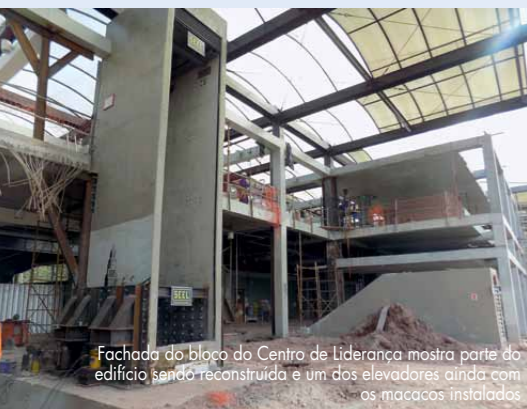
Fachada do bloco do Centro de Liderança mostra parte do edifício sendo reconstruída e um dos elevadores ainda com os macacões instalados