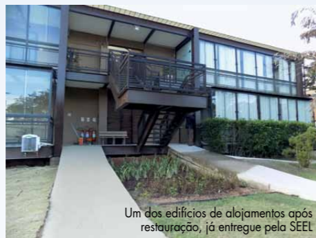
Um dos edifícios de alojamentos após restauração, já entregue pela SEEL