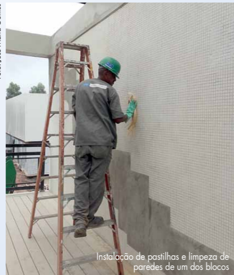
Instalação de pastilhas e limpeza de paredes de um dos blocos