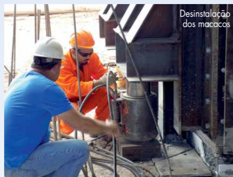
Desinstalação dos macacões