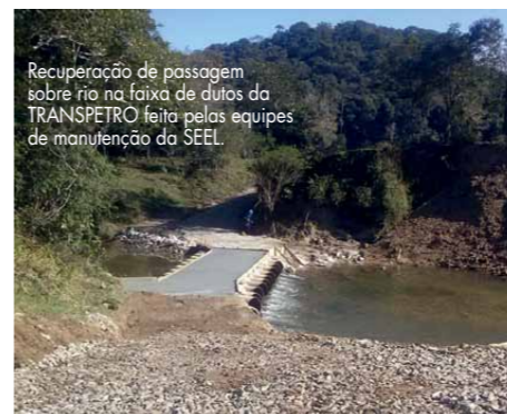
Recuperação de passagem sobre rio na faixa de dutos da TRANSPETRO feita pelas equipes de manutenção da SEEL.