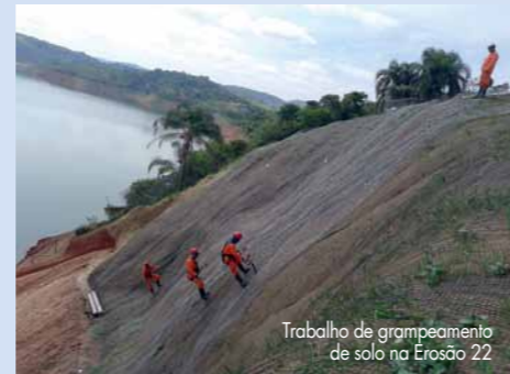
Trabalho de grampeamento de solo na Erosão 22