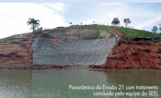
Panorâmica da Erosão 21 com tratamento concluído pela equipe da SEEL