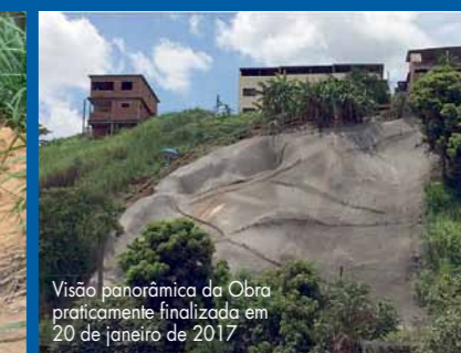
Visão panorâmica da Obra praticamente finalizada em 20 de janeiro de 2017