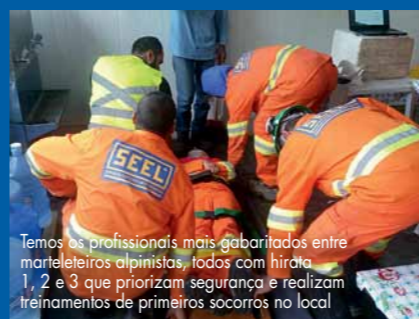
Temos os profissionais mais gabaritados entre marleteiros alpinistas, todos com hirata 1, 2 e 3 que priorizam segurança e realizam treinamentos de primeiros socorros no local