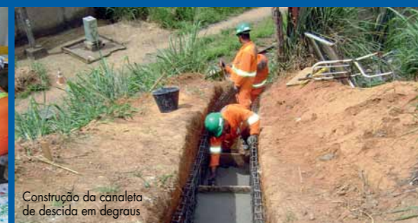
Construção da canaleta de descida em degraus