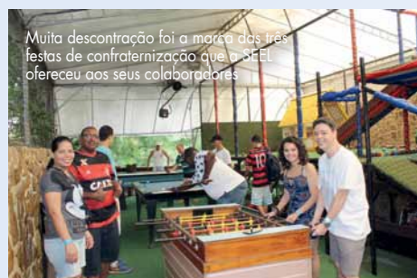
Muita descontração foi a marca das três festas de confraternização que a SEEL ofereceu aos seus colaboradores.