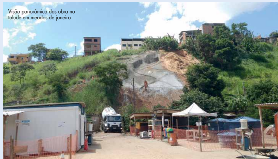
Visão panorâmica das obra no talude em meados de janeiro