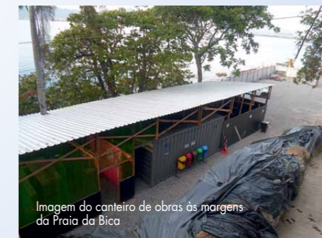
Imagem do canteiro de obras às margens da Praia da Bica

tervenção da obra, mas também passa pela retirada de cada material, de galhos e plantas e descarte de resíduos. O contrato da Obra 742 prevê duração até o final de dezembro, mas Casadó pretende antecipar esse prazo em até dois meses, entregando tudo concluído até o final de outubro. Na última edição do ano o Jornal da SEEL apresentará as imagens finais do solo grampeado.