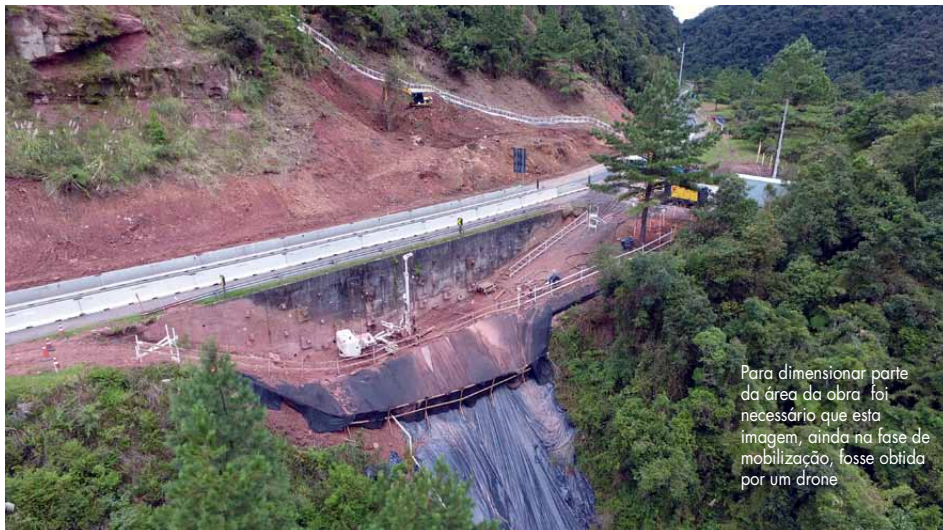
Para dimensionar parte da área da obra foi necessário que esta imagem, ainda na fase de mobilização, fosse obtida por um drone

Serão todos os tipos de soluções que a SEEL aplica no mercado para seis contenções em uma mesma obra — Pág. 4