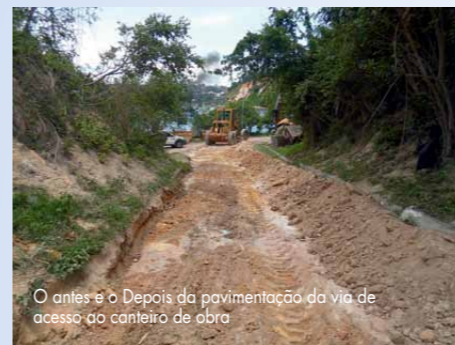
O antes e o Depois da pavimentação da via de acesso ao canteiro de obra