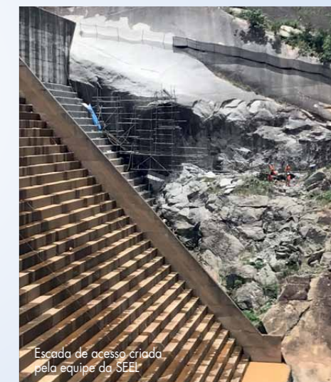
Escada de acesso criada pela equipe da SEEL