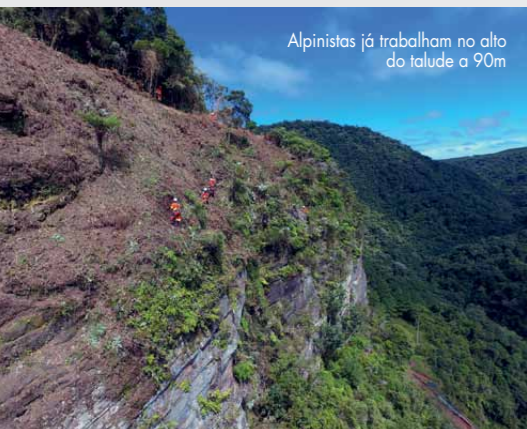
Alpinistas já trabalham no alto do talude a 90m

EQUIPE COM 88 PESSOAS INICIA SEIS CONTENÇÕES NA SERRA DO ESPIGÃO (SC)