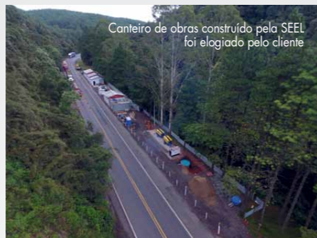
Canteiro de obras construído pela SEEL foi elogiado pelo cliente

iremos lidar. Tudo foi mapeado; há trechos com blocos de rochas maiores e outros com blocos menores”, revela Felipe. Segundo o engenheiro, a obra é tão complexa que durante o mês de março foi trabalhada apenas questão do acesso e da limpeza do talude em toda a sua área de 30 mil m 2 - a questão ambiental é prioritária para o cliente, o Grupo Arteris. “A partir de maio usaremos helicópteros para levar material ao topo do talude”, informa o engenheiro coordenador.