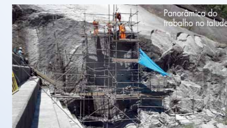
Panorâmica do trabalho no talude

que o nosso trabalho atendeu perfeitamente o que foi proposto em termos de segurança”, finaliza. Nas imagens desta matéria mostramos parte do acesso que foi criado e a execução de drenos e tirantes.