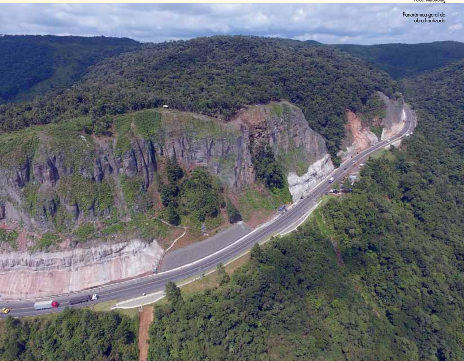
Panorâmica geral da obra finalizada

A beleza do acabamento das cortinas atirantadas e dos imensos taludes cobertos por telas e concreto projetado traz muito mais do que a visão de uma obra impecável em detalhamento: garante a tranquilidade e a segurança de evitar escorregamentos que possam atingir a estrada BR-116, entre os municípios de Monte Castelo e Santa Cecília (SC), e os cerca de 200 mil veículos que, em média, mensalmente cruzam aquele trecho da Serra do Espi-